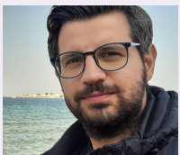
Ahmet Eren Özen Seçimlerin İlk Turu Bitti Sayfa: 3 - 4