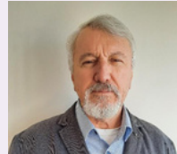
H. Zeki Sungur İçimizdeki Şeytan Sayfa: 11 -13