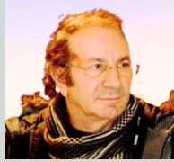
Metin Cansız ETRÜSKLER Sayfa: 3