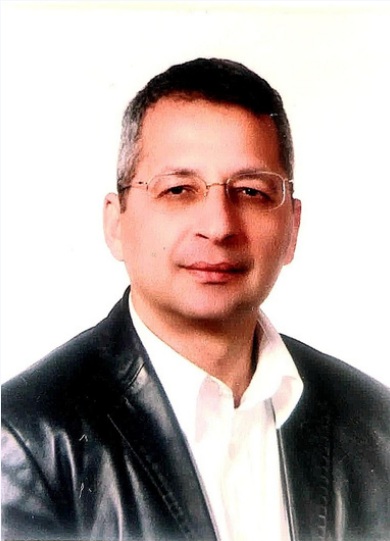
Bülent Selçuk yazdı