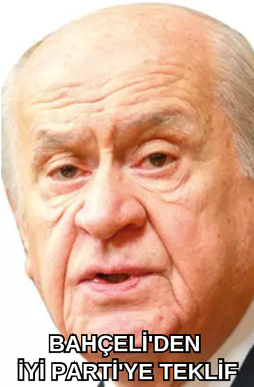
BAHÇELİ'DEN İYİ PARTİYE TEKLİF

Rus haber ajansı TASS, Rusya'nın Güney Kıbrıs Rum Yönetimi (GKRY) Büyükelçiliği'nin, Kuzey Kıbrıs Türk Cumhuriyeti (KKTC) başkenti Lefkoşa'da Rus vatandaşlarına yönelik konsolosluk hizmeti vermeye başlayacağını bildirdi. Bu karar Rusya'nın bir anlamda KKTC'yi tanıdığını gösteriyor.