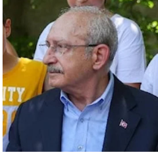
CHP Genel Başkanı Kemal Kılıçdaroğlu, sosyal medya hesabı aracılığıyla iktidarı eleştirdi. Ve şunları söyledi:

Yurt dışı piyasalarda yatırımcılar perşembe günü başlayacak Jackson Hole'a kilitlendi. Gözler Fed Başkanı Jerome Powell'ın Jackson Hole Ekonomi Politikaları Sempozyumu'nda yapacağı konuşmaya çevrildi. Powell'ın açıklamalarında, Fed'in olası para politikası adımlarına ilişkin ipuçları beklenirken, söz konusu açıklamaların piyasalarda oynaklığı artırabileceği tahmin ediliyor. Bugün Almanya üretici fiyat endeksi kamuoyuyla paylaşılacak.